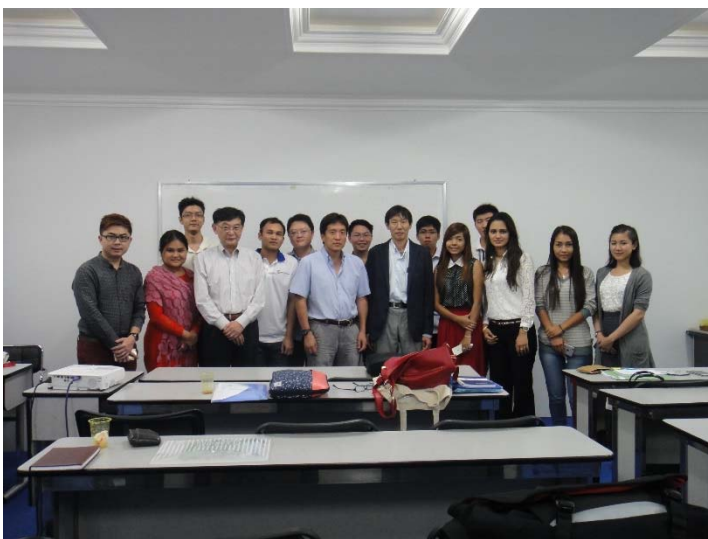
セミナー終了後の集合写真