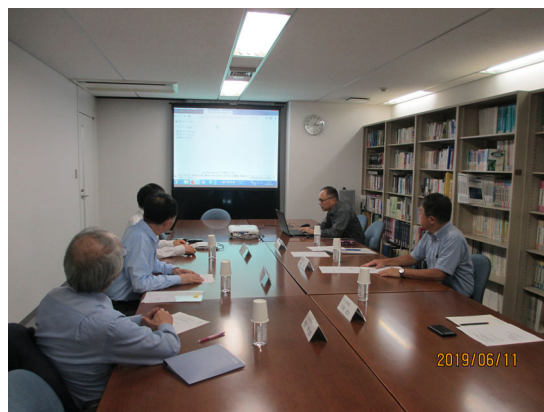
第1回委員会の模様

第1回委員会開催 令和元年6月11日 第2回委員会開催 7月23日 第3回委員会開催 10月8日 第4回委員会開催 11月1日