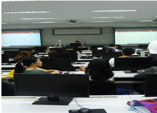
チェンマイ大学経済学部におけるセミナー風景