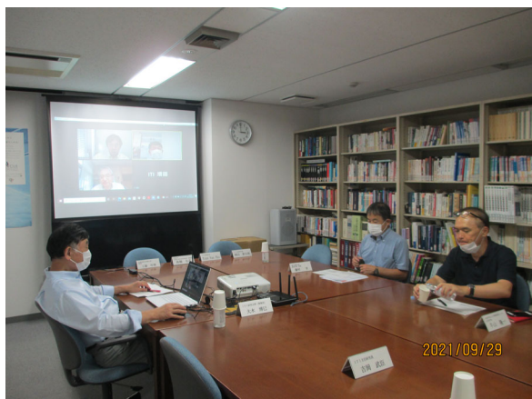
第 2 回研究会の様様